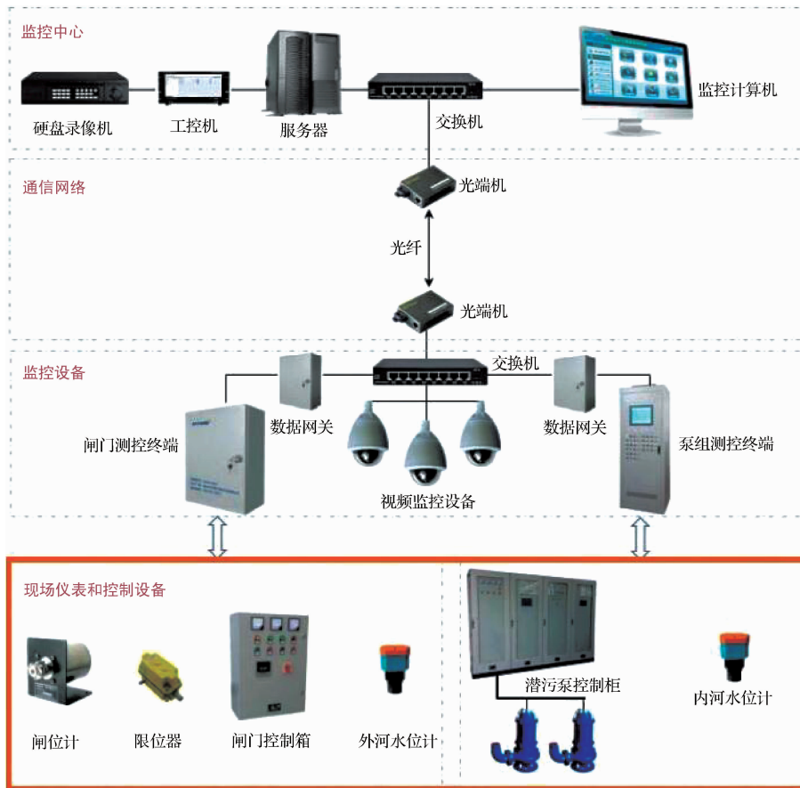
图1 监控系统架构示意